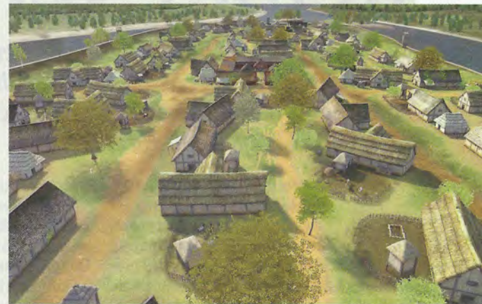
La Lutèce gauloise (autour de - 50 av. J.-C.) se limitait à de simples huttes installées sur une île de la Seine.

Les rois, les empereurs, les savaient et s'en méfiaient : le peuple parisien a le sang chaud. Il s'est soulevé à tous les siècles, lançant le pays entier (du fait de la centralisation française) dans des aventures politiques que,