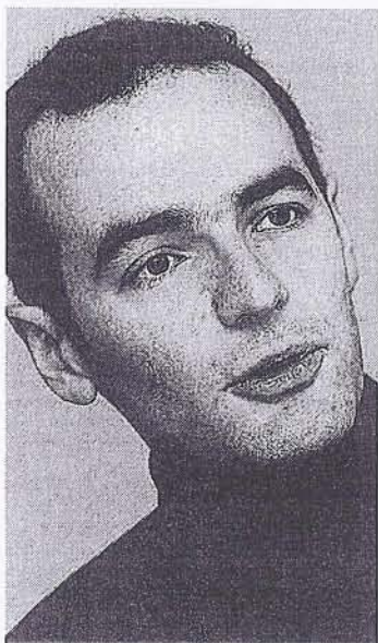
Franck Ferrand, historien et chroniqueur sur Europe 1.

« Madame Catherine » raconte la prise de pouvoir par Catherine de Médicis, l'épouse d'Henri II, en conflit ouvert avec Diane de Poitiers, la favorite du roi. Lorsqu'Henri succède à son père, Catherine endure patiemment la puissance de sa rivale. Diane fait la guerre et la paix en fonction de