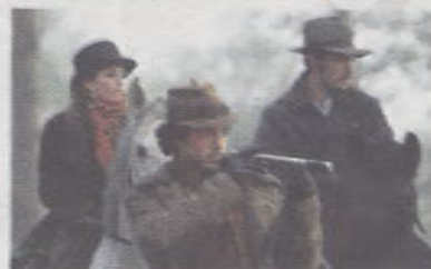
◀ Sherlock Holmes 2 : jeu d'ombres ★★☆☆☆ Deuxième opus des aventures revisitées du détective le plus célèbre du Royaume-Uni. 20.55, TF1.