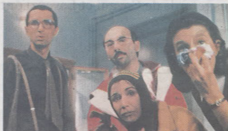
▲ Le Père Noël est une ordure ★★☆☆☆ Répliques cultes pour un film culte qui propulsa l'équipe du Splendid au rang de stars. 20.45, France 2.