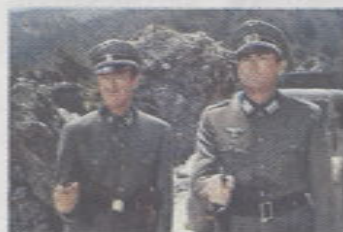
▲ Les Canons de Navarone ★★☆☆☆ Dangereuse mission, entre Grèce et Turquie, pour David Niven et Gregory Peck. 20.45, Arta.