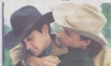
▲ Le Secret de Brokeback Mountain ★★☆☆☆ Tragique histoire d'amour entre deux cowboys dans le Wyoming des années 1960. 20.50, HD1.